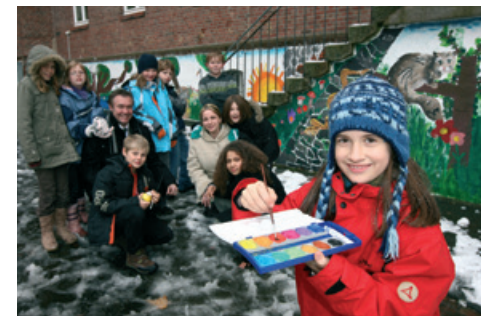
Mauerbemalung mit gefährdeten Tieren an der Grundschule Königstor