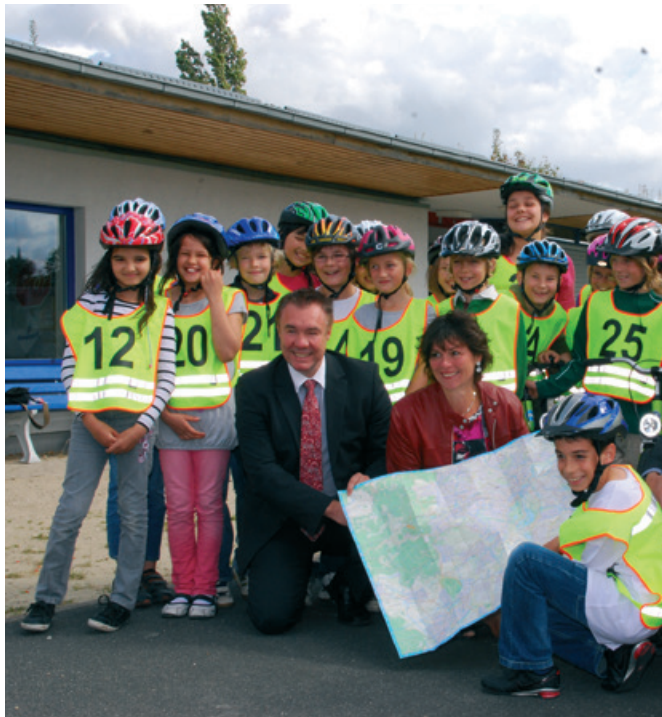
Fahrradstädtpläne für die Kinder aller 4. Grundschulklassen. Hier symbolische Überreichung durch Jurymitglieder an Schüler der Dorothea-Viehmann-Schule.

Die Jury der Bildungsinitiative, in der Vertreter der Bildung, der Stadt Kassel und der Städtischen Werke mitwirken, trifft sich zweimal jährlich. Sie legt fest, welche der eingereichten Projekte in welchem Umfang finanziert werden. Bei positiver Entscheidung werden die Eckpunkte der Förderung in einem Vertrag festgehalten. Der Vertragspartner muss geschäftsfähig, das heißt volljährig sein.