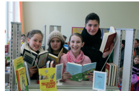
Aufbau einer gemeinsamen Schülerbücherei in der Astrid-Lindgren-Schule und Hupfeldschule

Nicht förderungsfähig sind Wiederholungsprojekte, bei denen sich lediglich die Teilnehmergruppe ändert, sowie Reparaturen oder Personalkosten von Schulen. Reine Ausstattungen oder Reisen werden nur gefördert, wenn sie konkret auf die Inhalte eines Projektes bezogen sind.