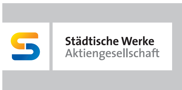
auf Fläche: Version Logofahne

Das Logo muss immer auf Weiß stehen. Auf farbigen Hintergründen, Fotos etc. deshalb immer die Version Logofahne verwenden!